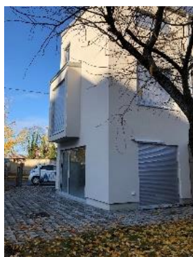
La maison HABIO

Les Terrasse du Jard rejoint la liste des programmes immobiliers NOV'HABITAT qui s'inscrivent dans les actions en faveur du cœur de ville. L'action Cœur de ville, qui associe les collectivités locales, le Mouvement HLM et Action Logement porte l'amélioration de l'offre locative en ville, l'activité commerciale et le dynamisme des centres-villes dans 222 villes françaises dont Châlons-en-Champagne.