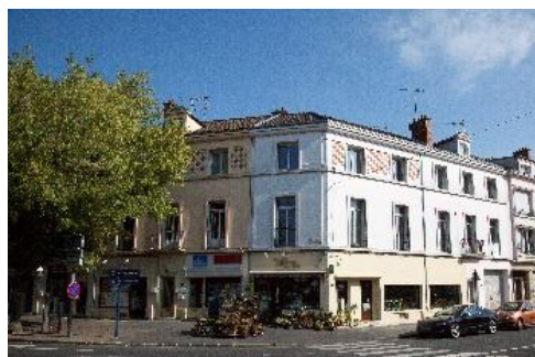
Résidence Grande Etape