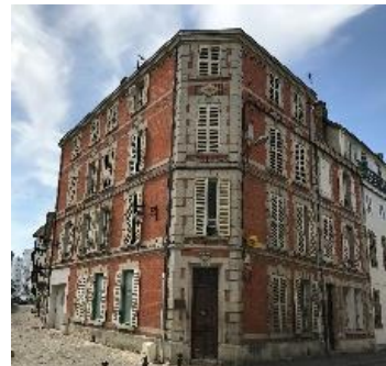
Résidence Notre Dame