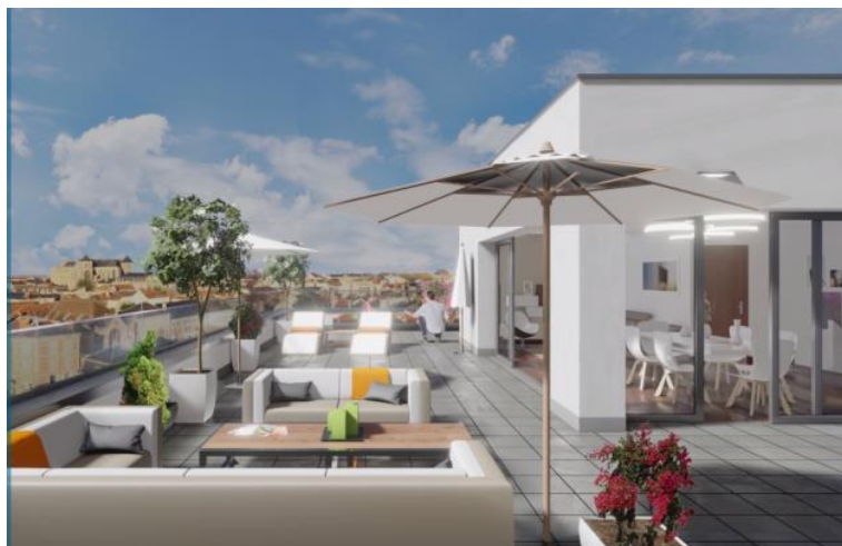
Appartement T5 en duplex inversé avec terrasse de près de 100 m 2 .

Dotées d'interphones connectés (smartphone, tablette) avec visio, de loggias et terrasses, et de stationnements privatifs en sous-terrain desservis par ascenseur, Les Terrasses du Jard accueillent 19 Logements Locatifs de standing (PLS) répartis sur 1400 m 2 de surface habitable.